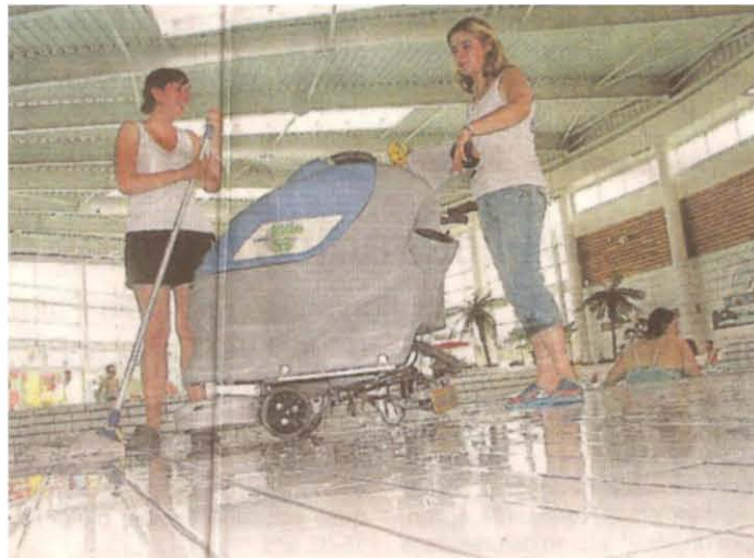
Les alentours des bassins sont nettoyés tous les jours juste après la fermeture.