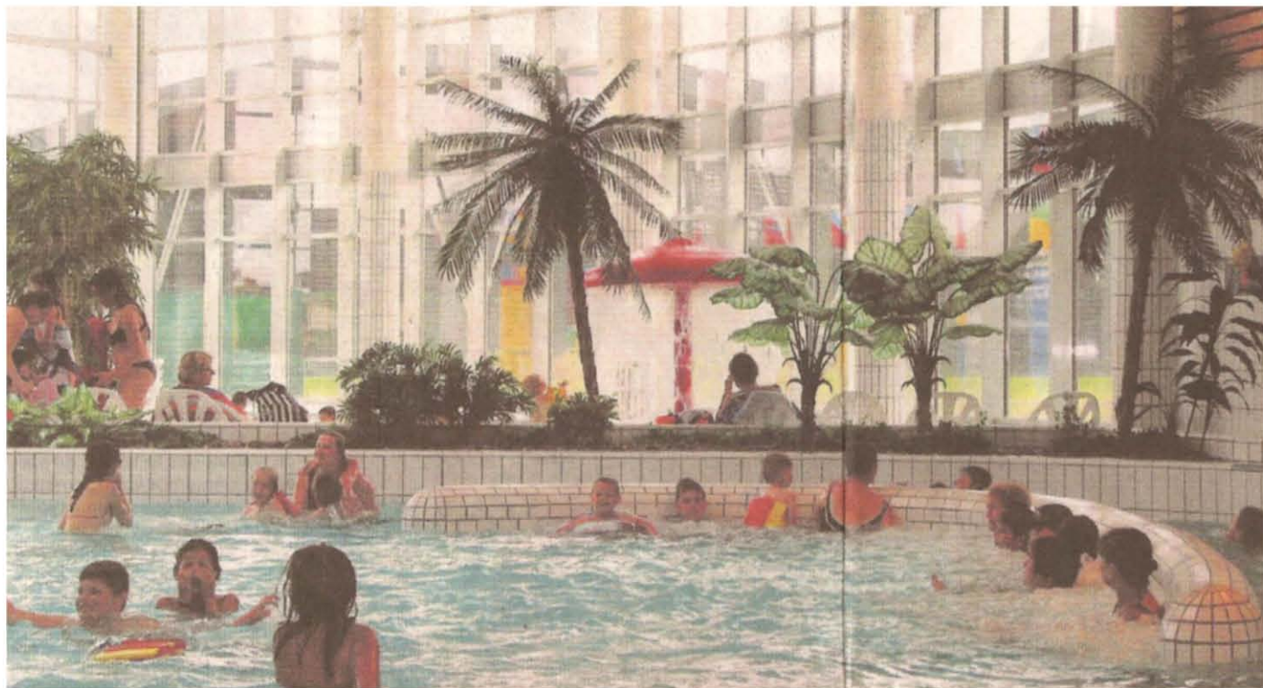
La piscine de Carpiquet peut accueillir jusqu'à 450 nageurs.

En coulisses. Cinq bassins et un espace balnéothérapie : le centre aquatique Sirena, à Carpiquet, est une grosse machine où tout est automatique.